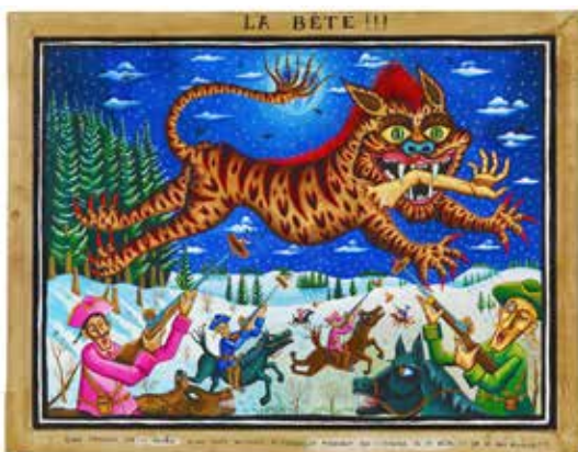
Gérard Lattier, Les balles ricochent ©Crédric Prat - Atelier L'oeil écoute Commune de Saint-Etienne-de-Lugdarès

Cette série est acquise en 2020 par la commune de Saint-Étienne-de-Lugdarès, lieu où la première victime officielle de la bête a été recensée (Jeanne Boulet, 14 ans, tuée le 30 juin 1764).