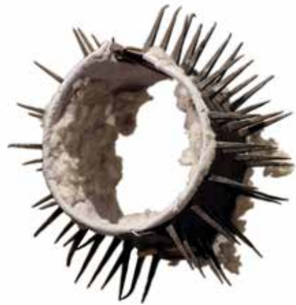
Collier de chien contre le loup