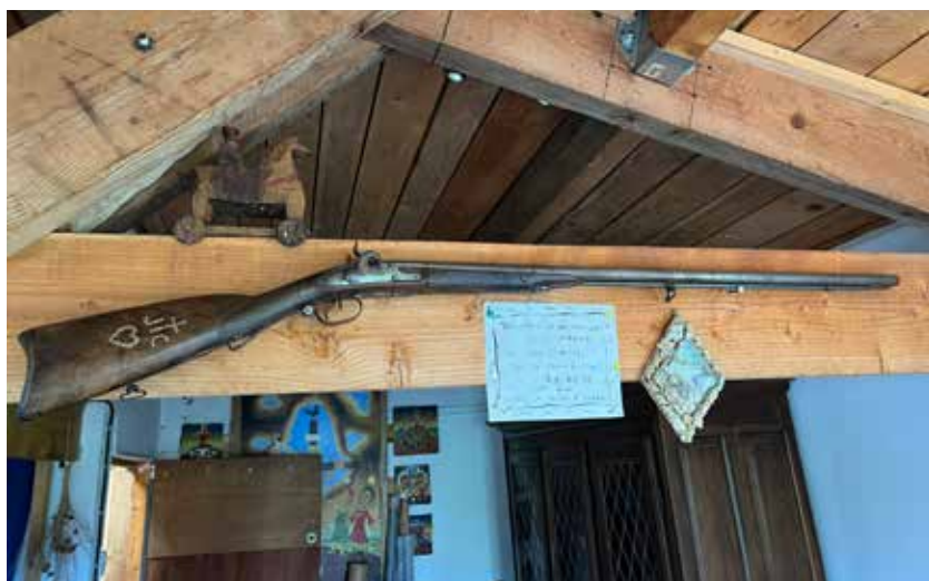
Le vrai-faux fusil de Chastel chez Gérard Lattier

Dans la 2 ème salle, ce sont les hypothèses qui sont présentées. Le visiteur est invité à voter pour choisir l'explication la plus plausible ou du moins qu'il préfère.