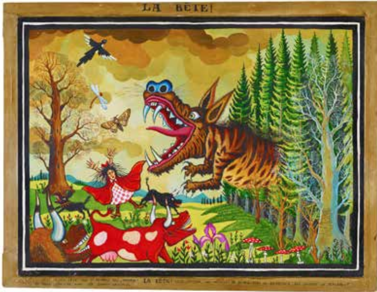
Gérard Lattier, La première attaque © Crédric Prat - Atelier L'œil écoute Commune de Saint-Etienne-de-Lugdarès

Du 30 septembre au 31 décembre 2022 à Maison Rouge – Musée des vallées cévenoles