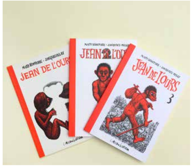
Jean de l'ours © L'Association