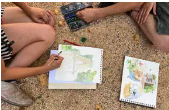
concours dessin 22

Sur inscription - (entrée au musée + 4€ la visite-atelier).