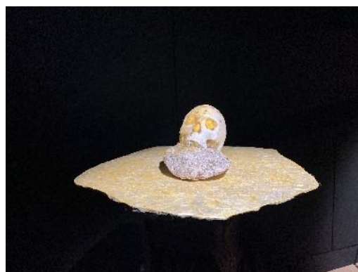
Dans l'exposition temporaire Autoportrait Carbone (2022) Crâne et lauze investis par les Bombyx