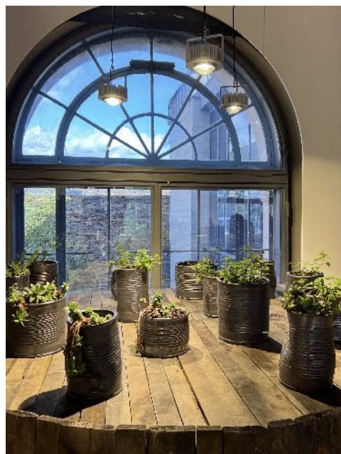
Dans l'exposition temporaire Pour manger des mûres, il faut mettre la tête dans le buisson (2022) Boîtes de conserve en terre cuite émaillée, orties, socle en châtaignier

Un bureau avec la carte des Cévennes, et toute une série d'objets (crâne, sabots, grillages..) recouverts de soie non tissée expriment son amour indicible pour ce territoire qui est le sien.