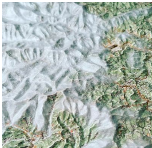
Dans l'exposition temporaire Il vaut mieux être petit maître - que grand valet (2022) Carte IGN du Parc national des Cévennes recouverte par les Bombyx