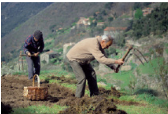
Labour au bigot à Notre-Dame-de-la-Rouvière dans les années 1990.