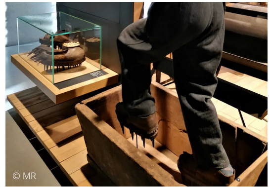
Décorticage à l'aide des « soles ». On obtient alors des « châtaignons » ou bajanas .

La production de châtaignes demande un savoir-faire particulier et nécessite des outils spécifiques. Les sòlas sont des chaussures à semelles de bois munies de grosses pointes barbelées. On s'en servait pour décortiquer les châtaignes. Après l'étape de séchage, les fruits étaient mis dans une auge en bois pour être piétinés par le porteur de « soles ». Cette technique, assez récente (XIX e siècle), est moins répandue que le sac pisador (sac en lin où l'on mettait les châtaignes avant de les battre sur un billot de bois).