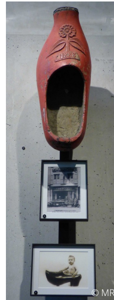
Enseigne, carte postale de la boutique Bergogne (26 place Saint-Jean à Alès) et photographie traditionnelle d'un des bébés de la famille.