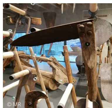
Coupe-ronce fait avec une lame de faux.