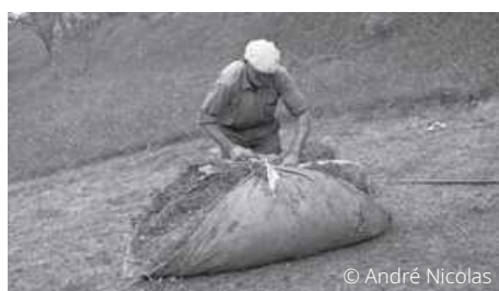
Confection d'un borrenc , Chamborigaud (drap rempli de végétaux, serré aux angles et porté sur le dos).