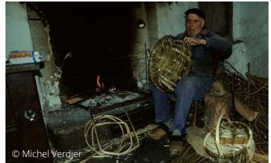
Confection de bertols dans le hameau d'Ardailiers (Valleraugue).