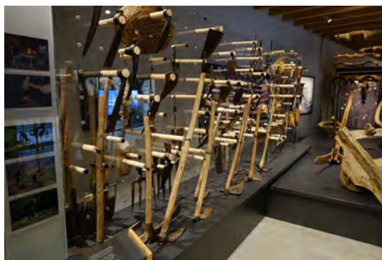
Les outils agricoles

des céréales, des légumes, des arbres fruitiers ou encore des châtaigniers et des mûriers. Ces constructions de terrasses se développèrent en parallèle de l'accroissement démographique que connut le territoire à l'époque médiévale. Tout comme la terre, l'eau est également rare en Cévennes. La population dut construire des aménagements hydrauliques pour l'amener jusqu'aux mas et aux terres cultivables. Pendant longtemps, les populations procédaient à des accords écrits ou verbaux afin de réguler l'utilisation de l'eau en fonction des heures, des jours et des saisons.