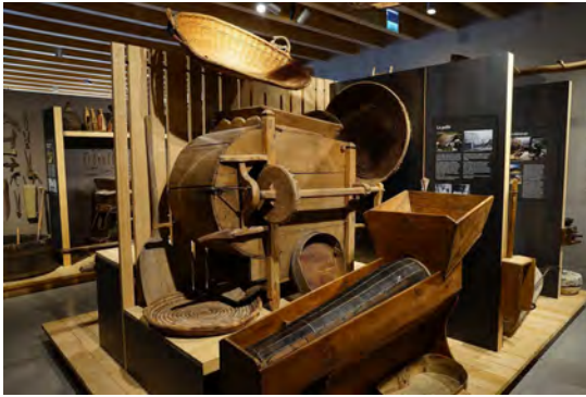
Production de céréales