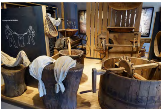
Décorticage des châtaignes

Récoltés à la mi-octobre les fruits sont déshydratés dans des séchoirs (ou « clèdes ») pendant 4 à 5 semaines, pour être conservés tout au long de l'année. Dans un souci constant d'économie, la population utilisait les feuilles de l'arbre pour la litière et la nourriture du bétail. Les taillis de châtaignier étaient utilisés pour la confection de vanneries et la fabrication de manches à outils. Au-delà de 30 ans, le bois servait à la réalisation de charpentes, de meubles. L'arbre se creusant naturellement, il a pu également servir de cachette pendant la période trouble des guerres de religions.