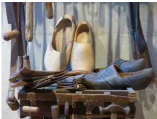
Sabots de bois

Les anciens cévenols racontent souvent qu'ils étaient trop pauvres pour s'acheter des chaussures. Beaucoup marchaient avec des sabots de bois et parfois même pieds nus. Imaginer marcher pieds nus ou en sabots dehors dans le froid de l'hiver est quelque chose de difficile à concevoir aujourd'hui. Cependant le métier de sabotier existait encore il y a 70 ans.