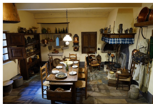
Salle commune typique des hautes vallées

La salle commune était la pièce dans laquelle la famille passait le plus de temps. La table, les chaises et les buffets sont des éléments caractéristiques du mobilier qui équipait cette pièce. La cheminée y tenait une place centrale. Sans électricité et gaz dans les habitations, cette cheminée était une source de lumière le soir et bien souvent la seule source de chaleur. Elle