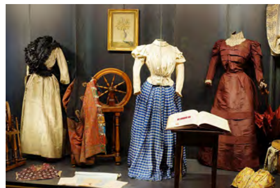
Vêtements féminins du XVIII e et XIX e siècle

Les vêtements en soie ont de tout temps été un produit de luxe. Les vêtements du XVIII e et XIX e siècles présentés dans le musée n'ont pas été produits à St-Jean-du-Gard ou dans les Cévennes. Ils proviennent de Lyon ou Nîmes.