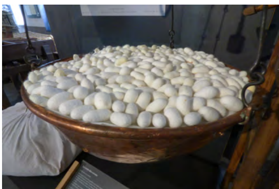
Pesée des cocons

Le papillon bombyx mori est un lépidoptère domestique à l'origine de la soie. Chaque année au printemps se déroulait l'éducation des chenilles appelées vers à soie. Dans un premier temps les femmes couvaient les œufs (ou graines) dans de petits sacs qu'elles portaient sous leurs vêtements.